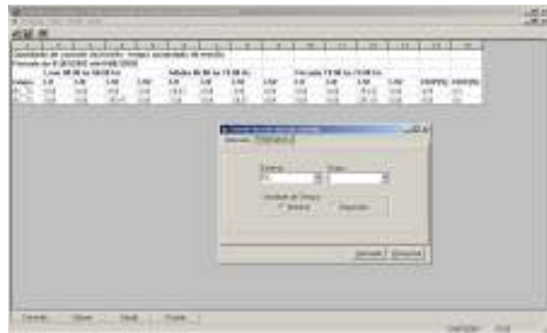
FIGURA 4 – DRP% E DRC% NO MÓDULO DE CONSULTAS

No módulo de Consultas do EMS / SCADA, disponibilizado na rede corporativa da empresa, é possível emitir relatório de "Tempo Acumulado de Tensão Fora de Faixa de Controle" para qualquer das subestações / Vãos do sistema, em um período de tempo escolhido. A seguir é apresentado um exemplo desse relatório para a subestação Brasília Centro.