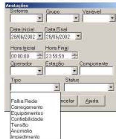
FIGURA 1 – JANELA DE SELEÇÃO

Os registros que atendem ao critério de seleção são apresentados em uma tela similar a de consulta a dados históricos, a menos que são zebrados de amarelo e branco. Um clique sobre um registro abre uma janela com todos os dados do registro e campos que permitem fazer o acompanhamento dos procedimentos de resolução do problema até sua conclusão, quando seu estado é passado para "Concluído". A figura a seguir apresenta uma tela de resultado de uma consulta, com um registro selecionado após um clique do "mouse" sobre uma linha.