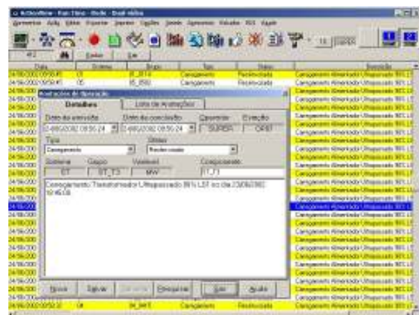
FIGURA 2 – REGISTROS DE GESTÃO DA QUALIDADE

Os registros que atendem ao critério de seleção são apresentados em uma tela similar a de consulta a dados históricos, a menos que são zebrados de amarelo e branco. Um clique sobre um registro abre uma janela com todos os dados do registro e campos que permitem fazer o acompanhamento dos procedimentos de resolução do problema até sua conclusão, quando seu estado é passado para "Concluído". A figura a seguir apresenta uma tela de resultado de uma consulta, com um registro selecionado após um clique do "mouse" sobre uma linha.